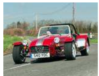
Caterham SV 40 Years of Caterham #116