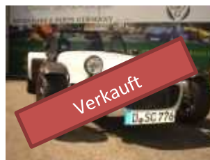
Caterham R300 SV #119