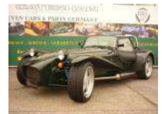
Caterham HPC 2.0 16V #120