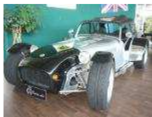
Caterham 1700 Super Sprint #109