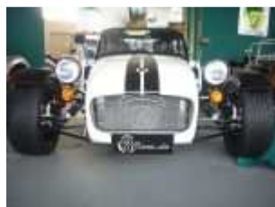
Caterham Seven 485 SV #118