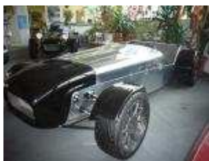
Caterham CSR260 Race in Vorbereitung #108

Wir suchen ständig gebrauchte Caterham Super 7.