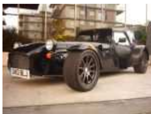
Caterham Seven 485 SV #117