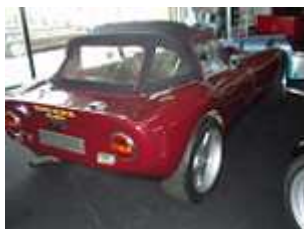
Sylva Fury Vorfürswagen #102