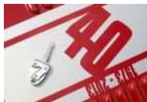
Caterham 40 Years of Caterham #115