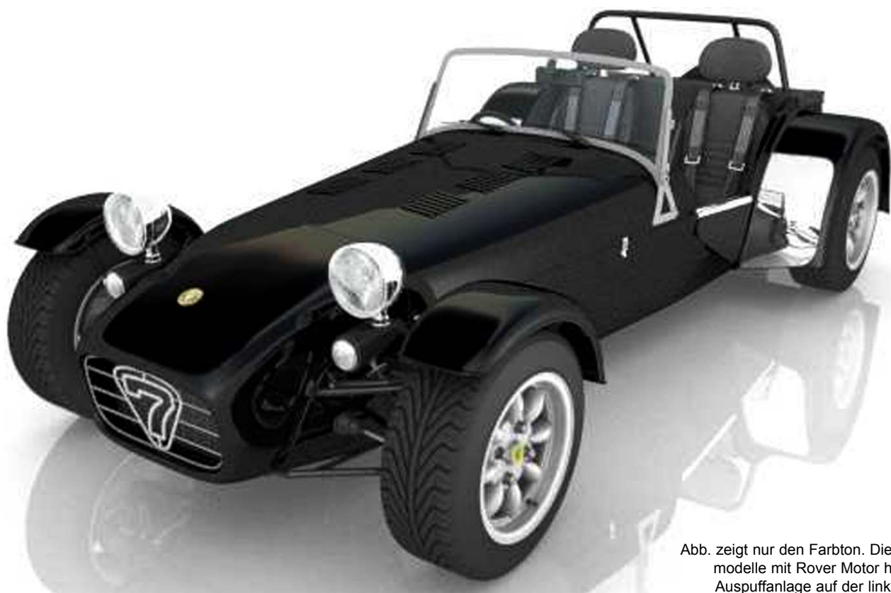
Abb. zeigt nur den Farbton. Die Sondermodelle mit Rover Motor haben die Auspuffanlage auf der linken Seite.

Scheibenbremsen vorn und hinten, De-Dion Hinterachse, Wetter Ausrüstung, heizbare und getönte Frontscheibe, 5 - Gang Getriebe.