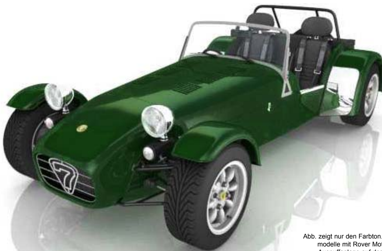
Abb. zeigt nur den Farbton. Die Sondermodelle mit Rover Motor haben die Auspuffanlage auf der linken Seite.

Scheibenbremsen vorn und hinten, De-Dion Hinterachse, Wetter Ausrüstung, heizbare und getönte Frontscheibe, 5 - Gang Getriebe.